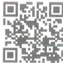
福源國小附幼網站